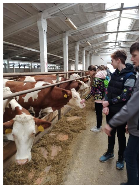
Projektový den na statku v Dobešicích

Celkový počet neomluvených hodin: 1. pololetí 5, 2. pololetí 278 Průměrný prospěch školy: 1. pololetí 1,309, 2. pololetí 1,352