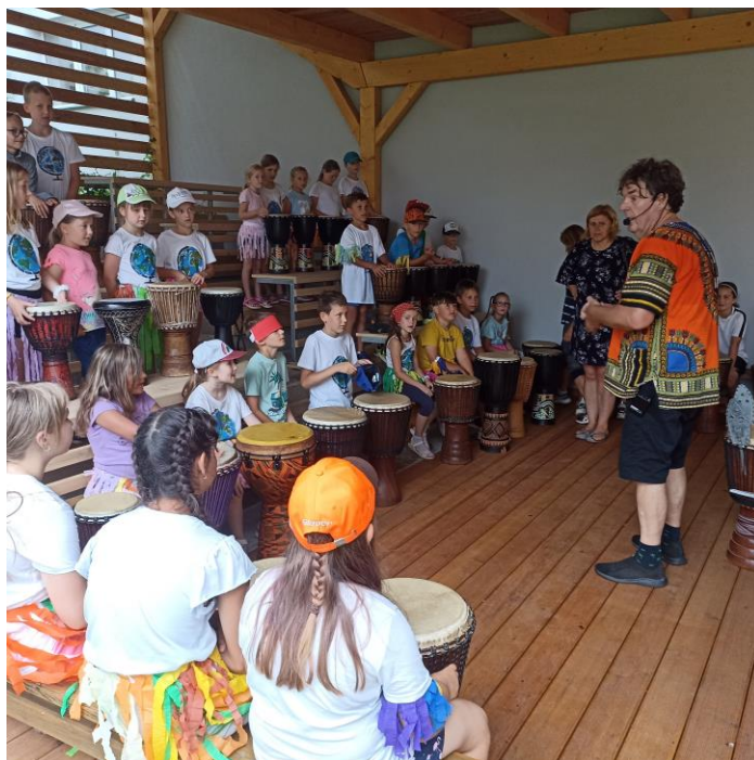
Příměstský tábor ŠD