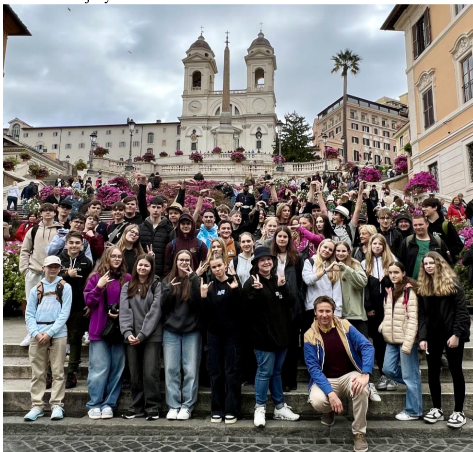
Španělské schody v Římě

Během prázdnin jsme uspořádali čtyři příměstské tábory. Největší zájem byl tradičně o dva tábory organizované školní družinou. Další dva tábory vedly kolegyně z prvního i druhého stupně, a to ve spolupráci s městem, které získalo dotace od Ministerstva vnitra ČR, a to v projektu Adaptace a integrace ukrajinských uprchlíků v Písku IV. Tento tábor byl bezplatný, účastnilo se ho celkem 34 dětí jak z Ukrajiny, tak z České republiky.