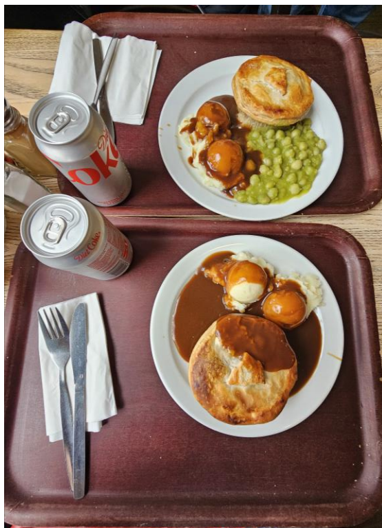
Anglie všemi smysly