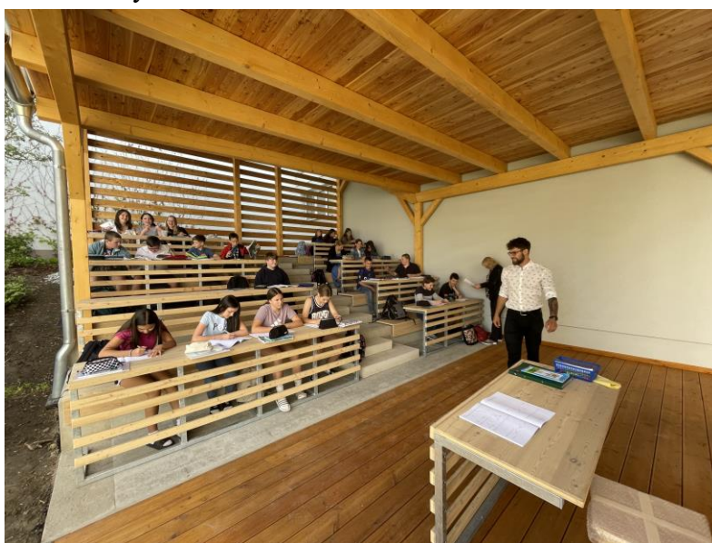
Výuka v nové venkovní učebně

Zvláštní místní podmínky: 201 dojíždějících žáků