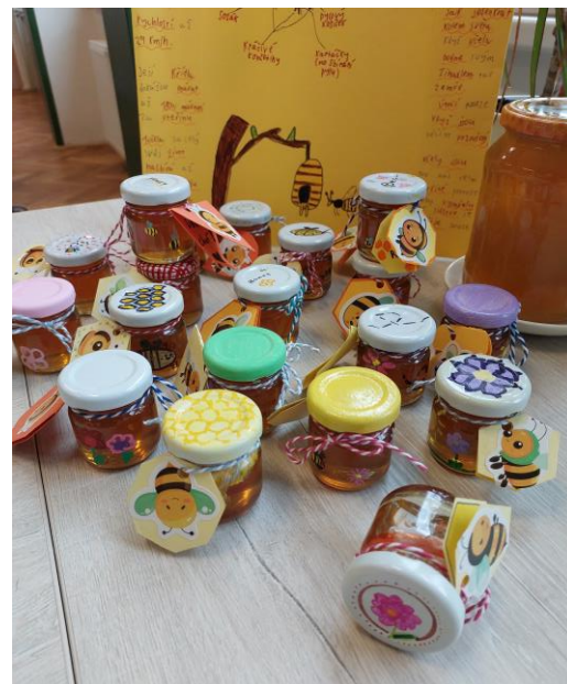
Výrobky dětí na charitativní akci