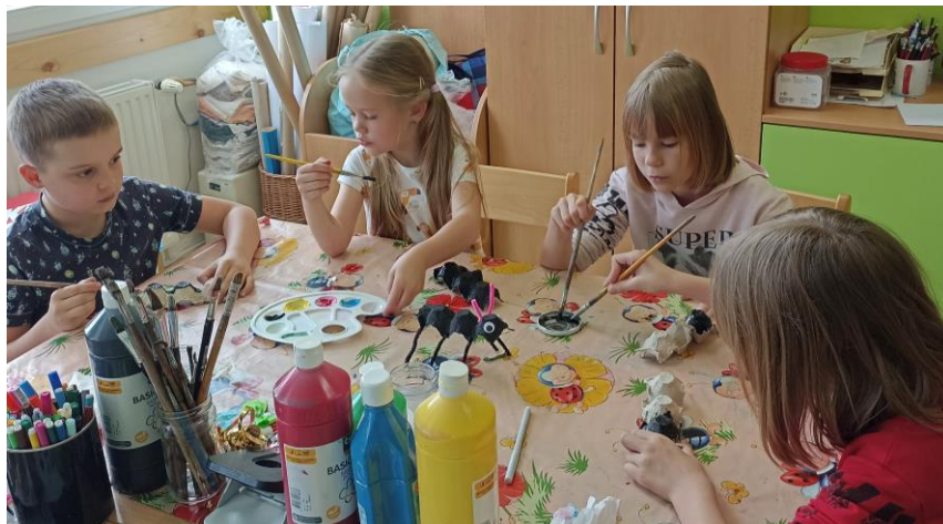
Tvořivá činnost v ŠD