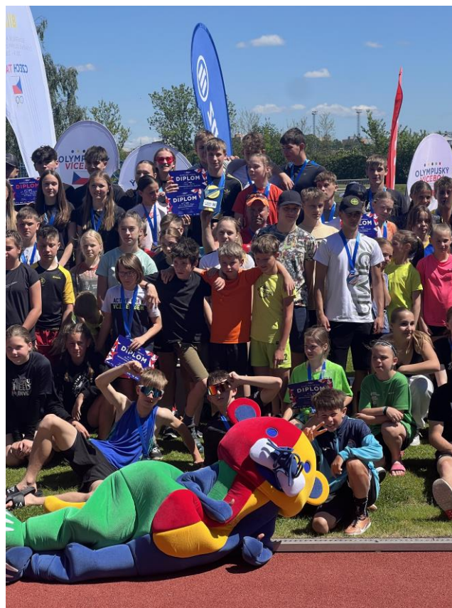
Krajské kolo odznaku všestrannosti