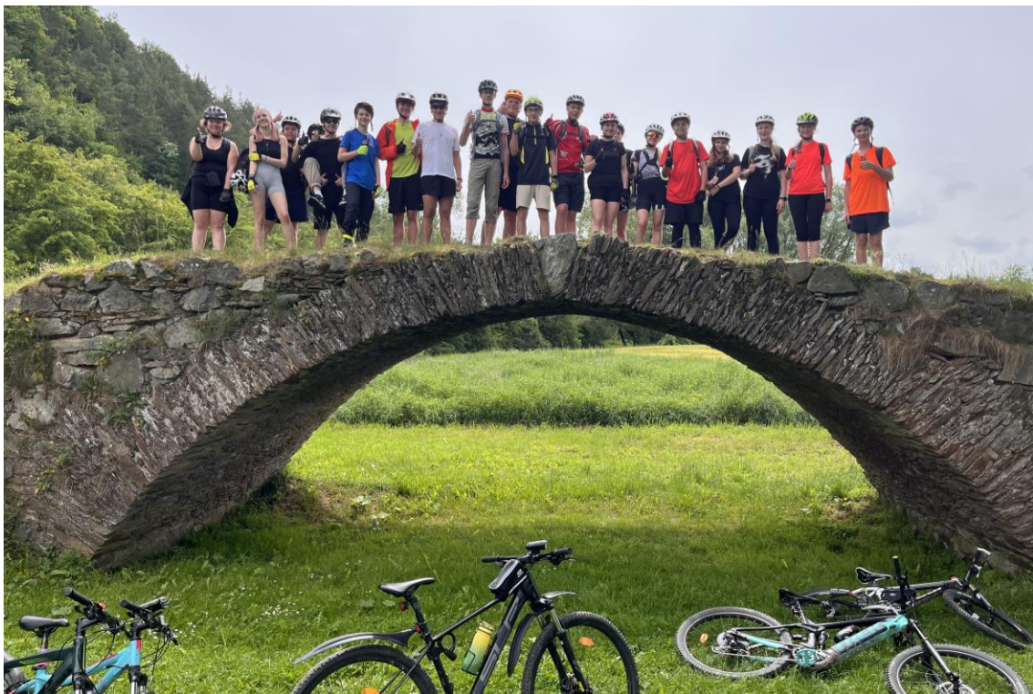
Sportovní kurz žáků devátých tříd