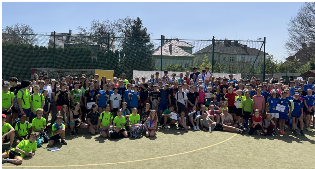
Účastníci okresního kola odznaku všestrannosti, které jsme organizovali na naší škole.