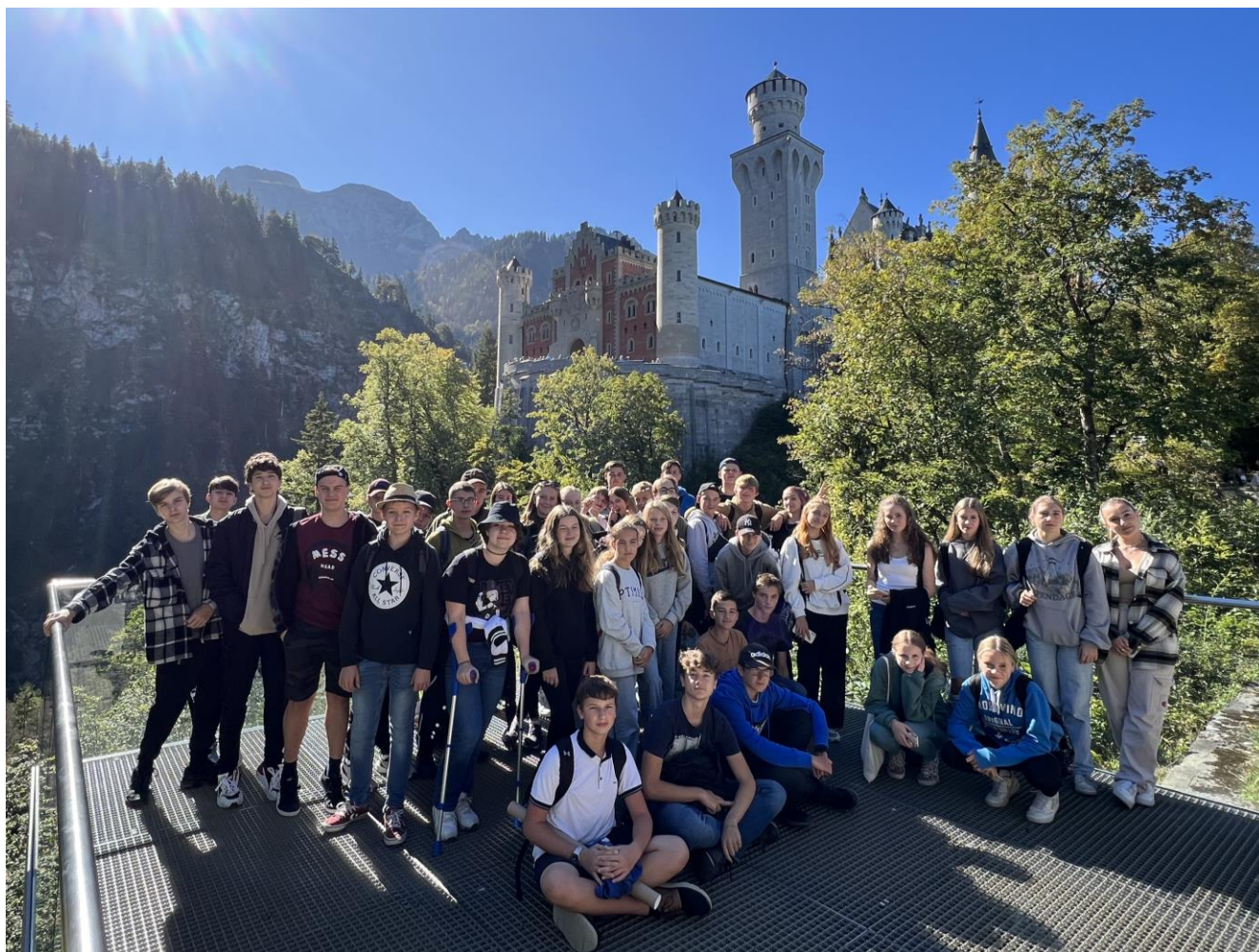
Při poznávacím zájezdu po Německu a Rakousku jsme navštívili také zámek Neuschwanstein

Na Ukrajině bohužel i nadále trvá válečný konflikt, což má dopad nejen do České republiky, ale konkrétně do každé školy, tedy i do té naší. Během školního roku k nám průběžně přichází a zase odchází ukrajinské děti. Pro učitele je taková práce velmi náročná. Žákům i kolegům se snažíme pomoci čerpáním různých dotací na jejich podporu. Pro začátek roku to bývají adaptační koordinátoři, pro celý školní rok se nám díky dotaci MŠMT podařilo zajistit ukrajinským žákům asistentku. Ta je nám velkou oporou při komunikaci s dětmi nebo jejich zákonnými zástupci. Dětem pomáhá s učením, začleňováním do třídních kolektivů a s celkovou adaptací v nové škole v cizím státě. Děti válečných uprchlíků jsme na začátku školního roku měli kolem čtyřiceti.